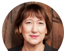
Hildegard Müller Präsidentin, Verband der Automobilindustrie e.V. (VDA)